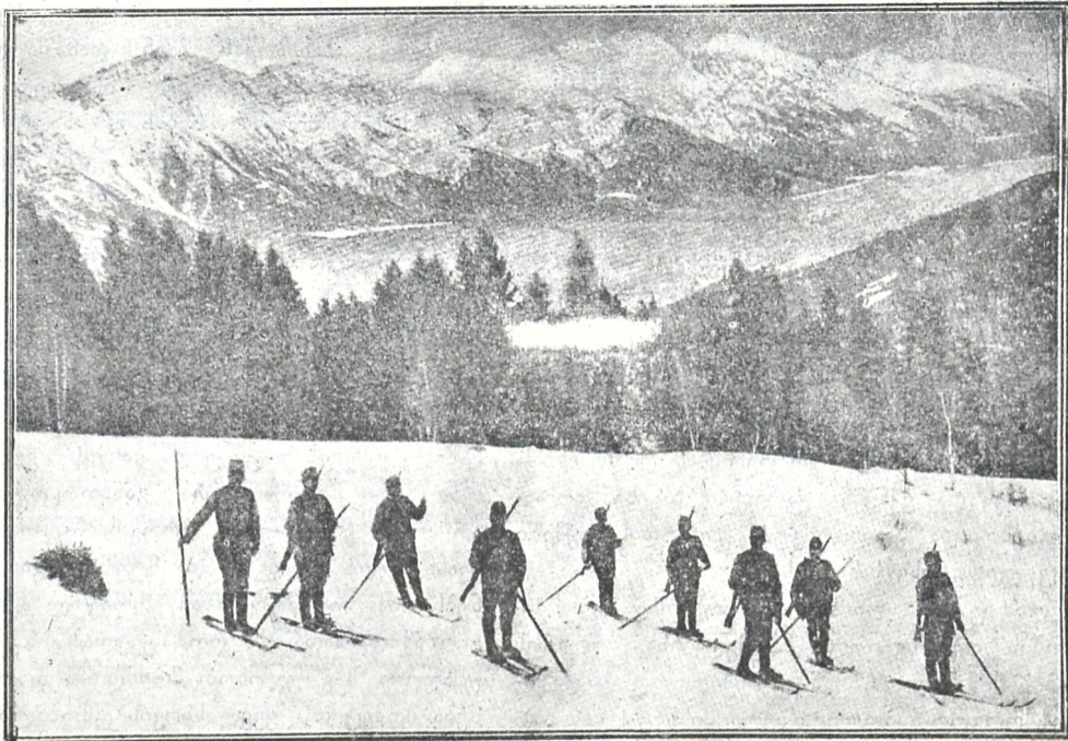
ავსტრიელი ჯარისკაცები თხილამურებით.