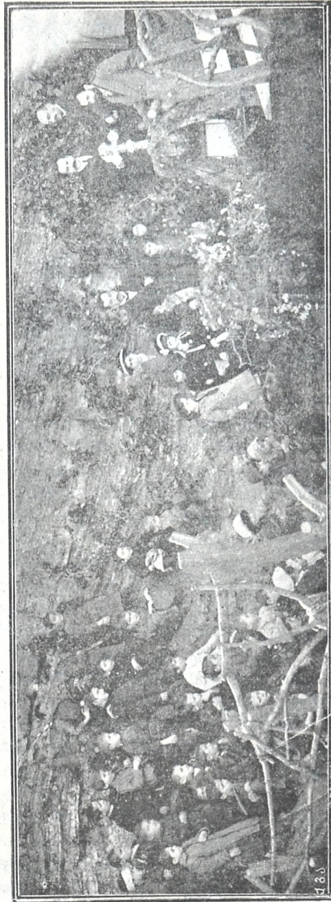
ბეშეები აკაკის საფლავთან.

რა თქმა უნდა, რომ სოფლის ბინადარი მცხოვრებლები არასოდეს არ იფიწყებენ განსვენებულს და ყოველ ჟამსა და წუთს იხსენიებენ მას. და თუ ანდერძით დავალებული ძეგლის მიზანიც მხოლოდ ის იყო, რომ უზრუნველ ეყო განსვენებულს ყოველ წუთს თვისი ხსენება და მემკვიდრეებმაც ასე გაიგეს, არ შეიძლება არ დავეთანხმოთ ამ უკანასკნელთ, რომ მართლაც და განსვენებულმა სიცოცხლეშივე დაიდგა ისეთი ხელთუქმნელი ძეგლი, რო-