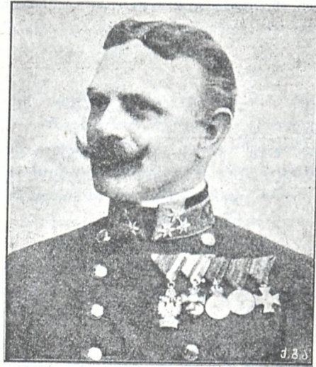
1. ერცჰერცოგი ფრიდრიხი, ავსტრიის ჯარების მთავარ-სარდალი, რომელმაც ვერ მოახერხა პერემიშლის განთავისუფლება. 2. გენერალი კუხმენკი, პერემიშლიას კომენდანტი.

ეწერით, და, როგორც ყველა სხვა კულტუროსან ერებს შეუქმნიათ, ჩვენც შევქმნათ საერთო აკადემიურ-ლიტერატურული ენაო. და წარმოიდგინეთ, კინაღამ გაიყვანა ეს მრავალთათვის (და მათ შრის თქვენ უმორჩილეს მონისათვისაც) ძნელად შესაგუებელი და «სახლაფორთო» მოსაზრება! კიდევ კარგი, რომ კრებაზედ აღმოჩნდნენ ისეთნიც, რომელთაც ბ. გორგაძეს სიტყვა „გაუტრიზანეს“ და დაგვარწმუნეს: სულ ტყუილია, „კაცმა როგორც გინდათ ისე სწეროს, ოღონდ გასაგებთ ილაპარაკოს; ჩვენ ლაპარაკიც არ ვიცითო“... ჩემი აზრითაც ეს სრული ქეშმარიტება გახლავთ: მართლაც და, მაგალითად, ქუთათურს თუ არ უთხარით: „კაზიონი გოროდის კლასში სტეკლოებს ვაჯენო“, — სხვანიარად ვერც კი გააგებინებთ, რის თქმა გინდათ. ერთი სიტყვით, „ჯინიანი“ და ახირებული კაცი ბრძანებულია ბ. გორგაძე!..